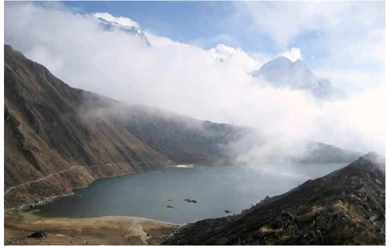
▲目前に迫力ある氷河を望み、チエオヒマールなどのヒマラヤ峰を映す絶景地のポンカールタル湖。サイドモレーンの道を歩いて湖畔を散策します