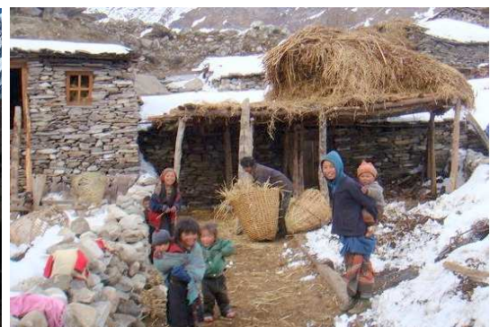
▲途中の村々では素朴な風景にも出会えます

◀ 広大なアブレーションバレー(氷河が削った谷)にあるビムタンは、マナスル山群、ブンギ、ヒムルン・ヒマール、パンバリヒマールなど360度に高峰がそびえ、居ながらにして山岳絶景に浸れる別天地です