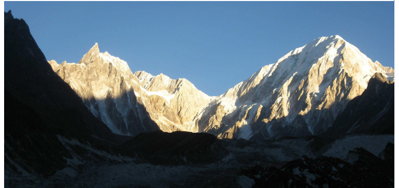
▲ビムタンから仰ぐ夕日に染まるネムジュン(右/7,139m)と、尖峰のティルジェピーク(左/6,532m)