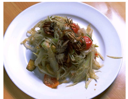
パイパヤのサラダ「タムマークフン」