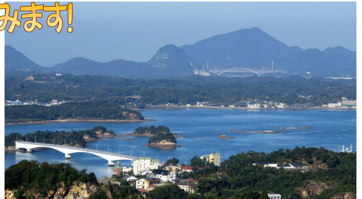
最終日には天草五橋のクルーズで天草の絶景観賞