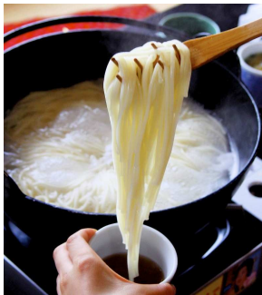
五島うどん(イメージ)