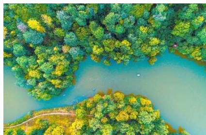
絵画のように美しい ディリジャン国立公園