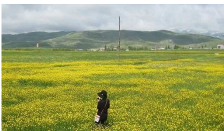
スピタク峠のキンポウゲ

南コーカサス山麓に広がるアルメニアは、国土の平均標高が 2,000m 以上という山岳国家。緑豊かな大地では野花の群落が見られるところで見られます。特に最も多様な花が見られるのが初夏から7月にかけて。この時季は、山間の村や高原、山麓をめぐる、様々なケシ、キンポウゲ、ホタルブクロ、グラジオラスなど 100 種以上もの草花を見ることが出来ます。荘厳で重厚なアルメニア教会の建築群や雪を抱くアララト山などが、そこにアクセントを添え、素晴らしい景観を見ることが出来るでしょう。今回は野花に詳しい専門ガイド(日本語)が同行。おすすめのフラワーハイキングのスポットを厳選してご案内します(掲載写真のお花畑はイメージです)。