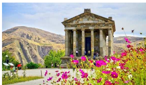
8世紀に建てられたガルニ神殿