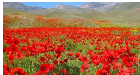
アラガツォトゥン地方のケシの群落