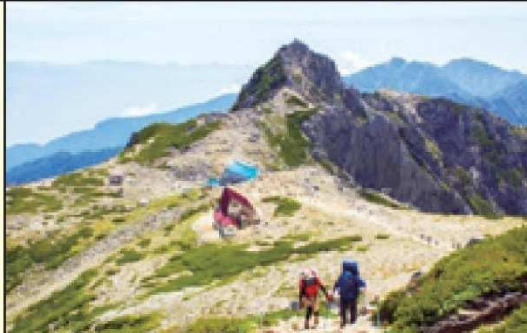
宝剣岳を眺めながら木曾駒ヶ岳へ

①新千歳または各地→中部または羽田=駒ヶ根=しらび平++千畳敷(2,612m) ②…八丁坂…乗越浄土(2,858m)…日本百名山木曾駒ヶ岳(2,956m)…馬ノ背…濃ヶ池(逆さ宝剣岳を映す氷河湖)…駒飼ノ池…乗越浄土…千畳敷(約6h)++しらび平=駒ヶ根 ③≡天竜峡(ライン下り)…渓谷遊歩道ハイキング…天竜峡大橋そら散歩…天竜峡温泉(約2h) ④=飯田=中部または羽田→新千歳または各地