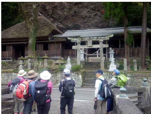
↑トレイル中には古刹、古社、石仏がいたるところに残ります(イメージ)