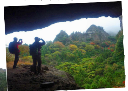
←↑T-4コースの最大の見どころのひとつ、大不動岩屋からはスケールの大きい岩峰群の絶景が見渡せませす(2日目)