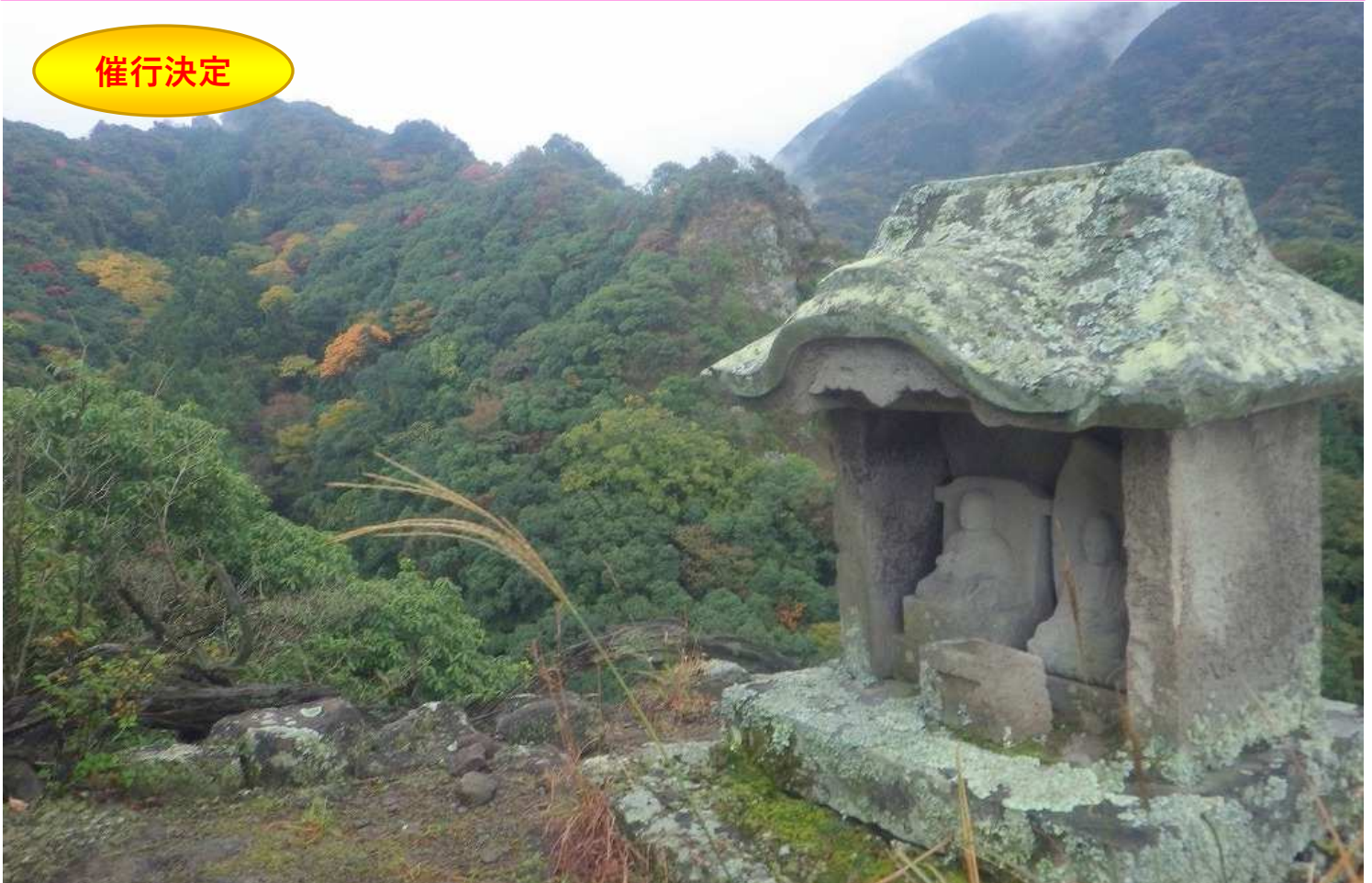
↑中山仙境の岩峰群を望む展望台にて。ひっそりと石仏を祀った祠があり、厳かな気持ちになります(2日目)

[利用予定航空会社] 全日空、ソラシドエアなど [利用予定ホテル] 豊後高田/真玉温泉スパランド真玉山翠荘 または同等クラス [1人部屋追加料金] 12,000円 [食事] 朝3回・昼0回・夕3回 [最少催行人数] 4名(最大8名) [添乗員] 新千歳空港から全行程同行。峯道ロングトレイル (2日目、3日目)には現地トレイルガイドが同行します