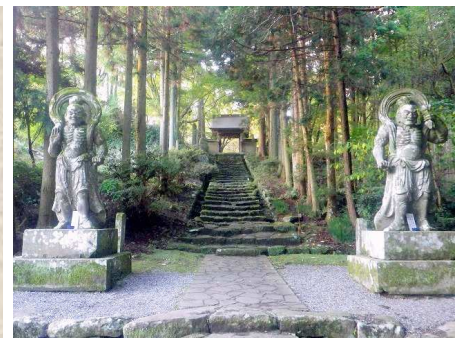
↑六郷満山の総寺院、両子寺の山門に威風堂々と立つ仁王像(3日目)

多くの山々が連なる国東半島に古来より息づいてきた山岳信仰。そこに奈良から平安時代、仏教と神道(宇佐八幡信仰)が融合し、独特の山岳仏教文化「六郷満山」が生まれました。その修行として行われたのが険しい岩峰や山道を縫って歩く「峯入(みねいり)」と呼ばれる難行です。この峯入コースを基本にハイキングルートとして整備されたのが「国東半島峯道ロングトレイル」で、熊野古道に匹敵する歴史古道として今、注目されています。当ツアーでは全10区間のトレイルの中から、国東半島の山深い絶景、由緒ある歴史や文化に触れる2コースを歩きます。