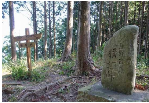
この地方特有の神木流紋岩の石畳が続く横垣峠。峠からは熊野灘の海が見渡せます(4日目)