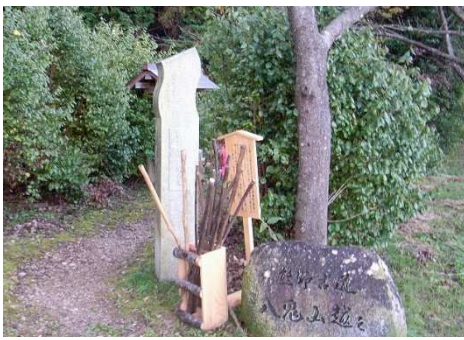
七曲りの急坂など難所の多い八鬼山越え。登山口に置かれた杖は自由に使えます(3日目)