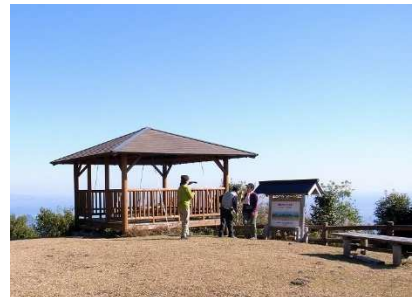
八鬼山越えの東屋からは好天なら那智山下山後、専用車で宿へ。 【尾鷲・泊】