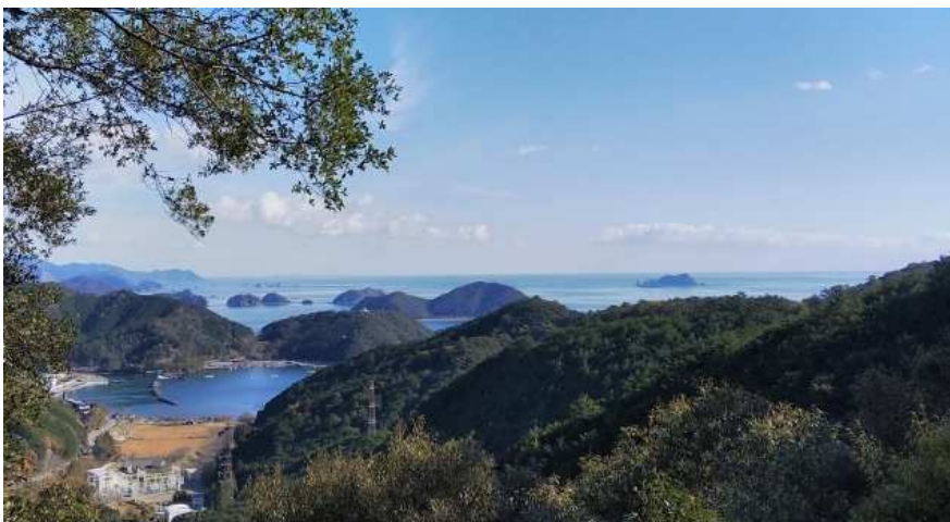
峠を越えて初めて目にする熊野灘の海原に感動します(イメージ)