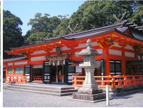
熊野三山の一社・新宮速玉大社でゴール