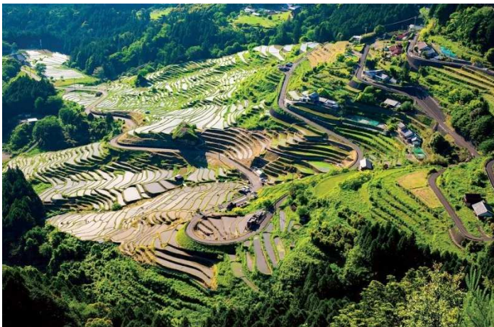
← 通り峠の展望 台からは見事な丸山千枚田の棚田を一望。7.2haもあり、日本の棚田百選のひとつ(4日目)