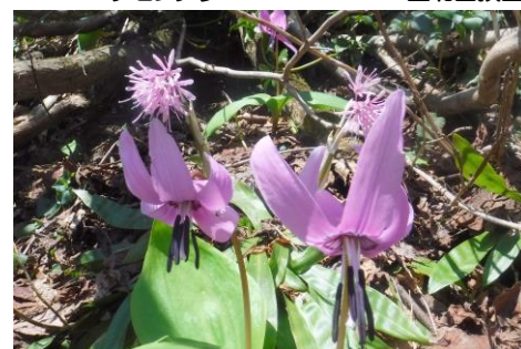
カタクリとショウジョウバカマ