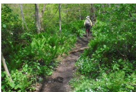
気持ちの良い樹間のコース(アオネバ)