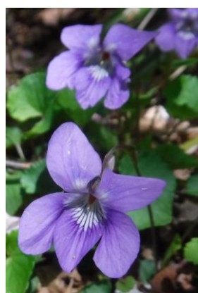
道路脇にも群生する高山植物群