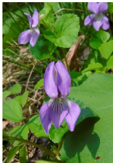
オオタチツボスミ