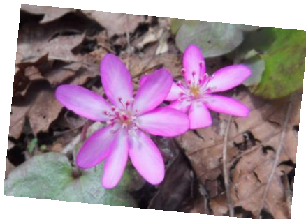
オオミスミソウ(雪割草)

※歩行の行程は原則として上記を予定しておりますが、現地事情により入れ替えや変更が生じる場合があります