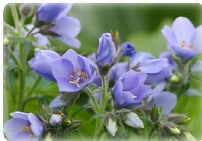
カラフトハナシノブ