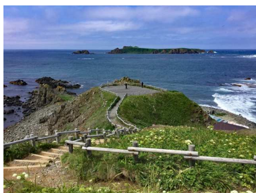
礼文島最北端スコトン岬。この果てはサハリン