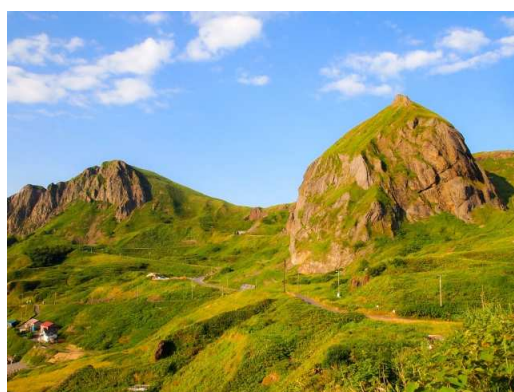
礼文島のシンボル「桃岩」