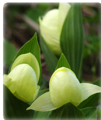
レブンアツモリソウ(礼文島固有種)