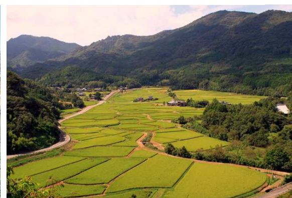
↑中世の農村景観を残す地として世界農業遺産に認定されている田染荘(1日目)