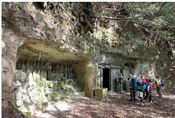
↑トレイル中には独特な意匠の国東塔(右)を始め、石仏、古刹・古社跡がいたるところに残されています(イメージ)