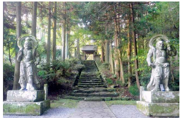
↑六郷満山の総持寺、両子寺の山門に威風堂々と立つ仁王像。国東半島を代表する石像です(3日目)

多くの山々が連なる国東半島に古来より息づいてきた山岳信仰。そこに奈良から平安時代、仏教と神道(宇佐八幡信仰)が融合し、独特の山岳仏教文化「六郷満山」が生まれました。その修行として行われたのが険しい岩峰や山道を縫って歩く「峯入(みねいり)」と呼ばれる難行です。この峯入コースを基本にハイキングルートとして整備されたのが「国東半島峯道ロングトレイル」で、熊野古道に匹敵する歴史古道として今、注目されています。当ツアーでは全10区間のトレイルの中から、国東半島の山深い絶景、由緒ある歴史や文化に触れる3コースを歩きます。