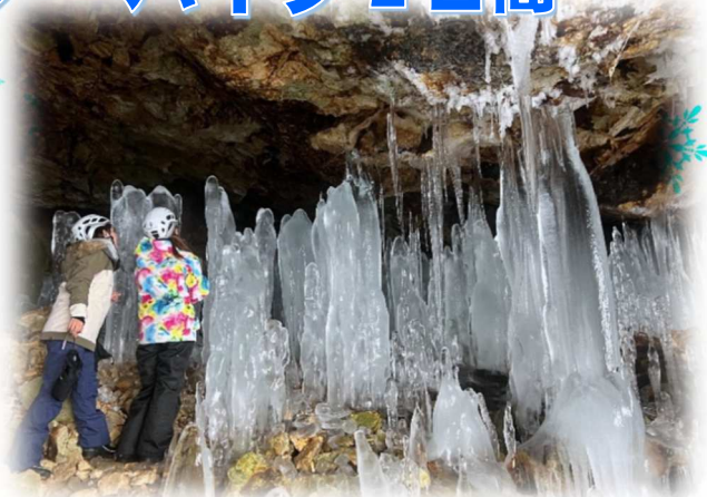
ニョロニョロの愛称で知られる大滝氷筍(イメージ)