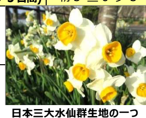
日本三大水仙群生地の一つ