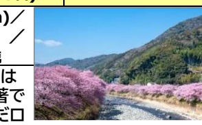
河津桜の並木(イメージ)